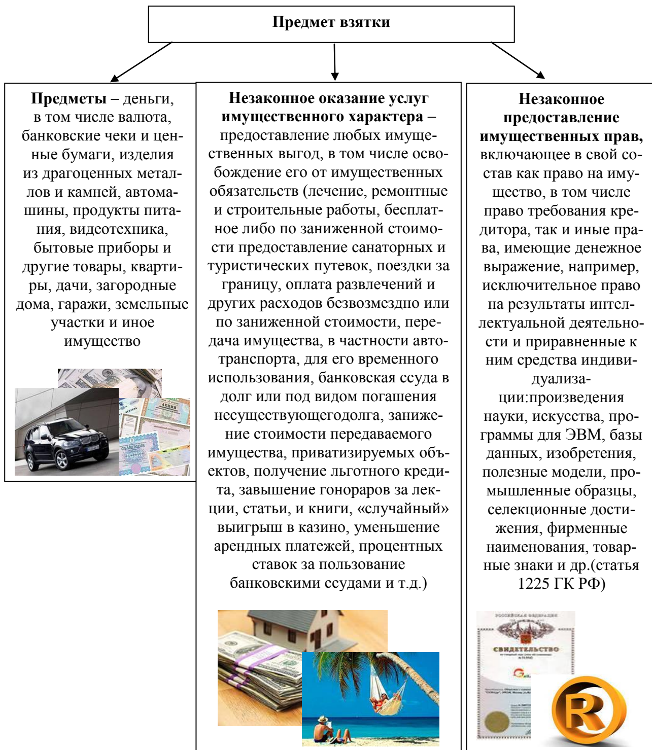
Рис.2 Предмет взятки

Получение взятки в виде незаконного предоставления должностному лицу имущественных прав предполагает возникновение у последнего юридически закрепленной возможности вступить во владение или распорядиться чужим имуществом как своим собственным, требовать от должника исполнения в его пользу имущественных обязательств и др. (п. 9 Постановления Пленума Верховного Суда РФ от 09.07.2013 № 24).